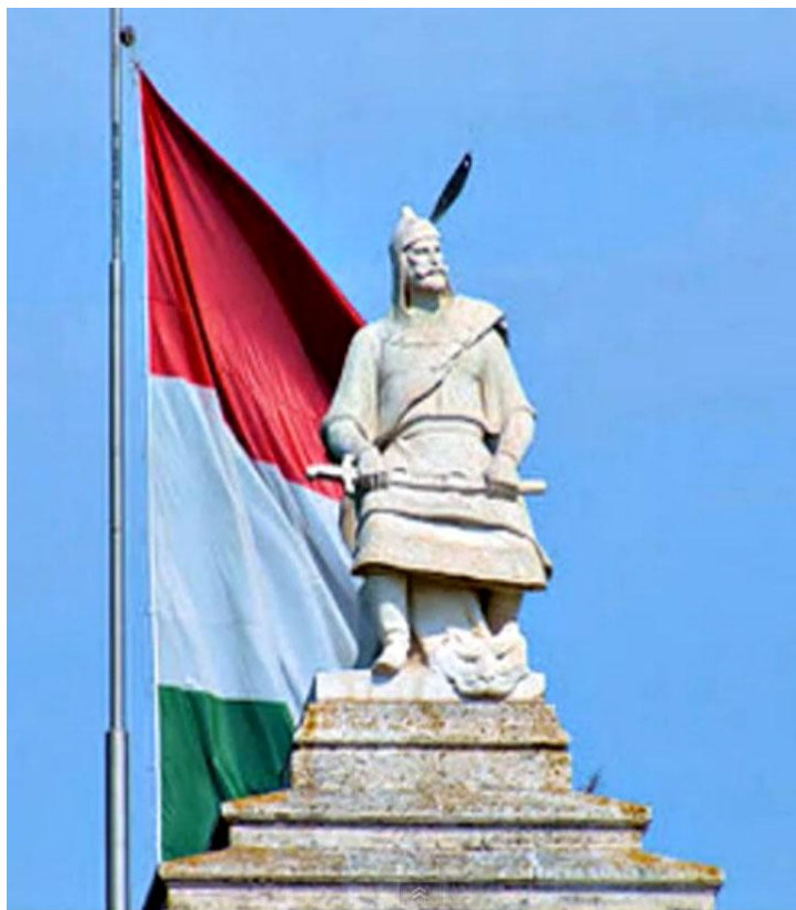
Hun atisi Atilla (406–453)

Pütkül hun qebililiri miladiyidin burunqi 3-esirde hun tengriqut (miladidin burunqi 209-174-yillar) teripidin birlishtürüp asiya hun impériyisini qurghan. Hun impériyisining jenubiy chégrasi bolghan xitayning chin sulalisi miladi 2- esirdin bashlap seddichin sépilini soqushni bashlighan bolup bu del asiya hun impériyisining eng küchlen'gen mezgillirige toghra kélidu. Xitay bu dewrlerde dawamliq türde hunlarning hujumigha uchap kelgenliki üçün sépil soqup özini qoghdighan we bu sépilni özining chégrasi qilghan. merhum uyghur tarix alimi turghun almas endi bu tarixni mundaq ikki kelimilik shé'ir bilen ipade qilip yekünleydu: "hun bowamdin qorqqanlar, seddichinni soqqanlar!".